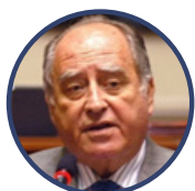
Antero Flores Aráoz

Diplomático brasileño. Fue ministro de Relaciones Exteriores de Brasil entre 2019 y 2021.