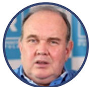
Rafael López Aliaga

Alcalde de la Ciudad de Lima. Presidente del partido Renovación Popular y expresidente de Solidaridad Nacional. Fue candidato a la presidencia de Perú en 2021.