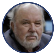
Domingo García Belaunde

Fue presidente del Consejo de Ministros, ministro de Defensa y expresidente del Congreso del Perú.